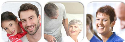
Erziehung von Kindern unter 8 Jahren

Beschäftigte, die von ihrem Wahlrecht Gebrauch machen wollen, müssen die tarifliche Freistellungszeit bis zum 31. Oktober für das Folgejahr beantragen. Zwischen dem 31. Oktober und dem 31. Dezember beraten Betriebsrat und Unternehmen darüber, wie das entfallende Arbeitsvolumen aufgefangen werden kann. Erst danach erhalten die Beschäftigten Bescheid. Für uns ist dabei klar: Wer die tarifliche Freistellungszeit in Anspruch nehmen will, der muss das tun können!