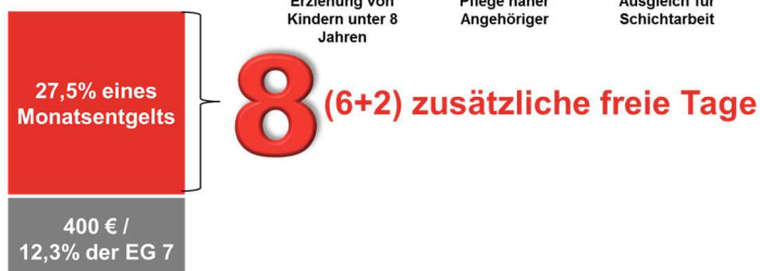
Ausgleich für Schichtarbeit