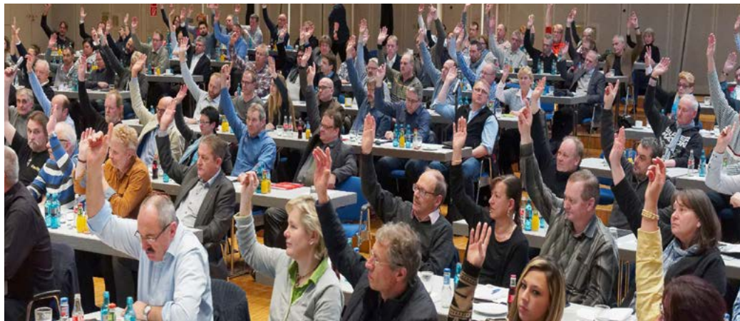
Einstimmig angenommen: Resolution für mehr Geld und mehr Gerechtigkeit

Den Unternehmen der Branche geht es nach einer aktuellen Umfrage unter Betriebsräten im